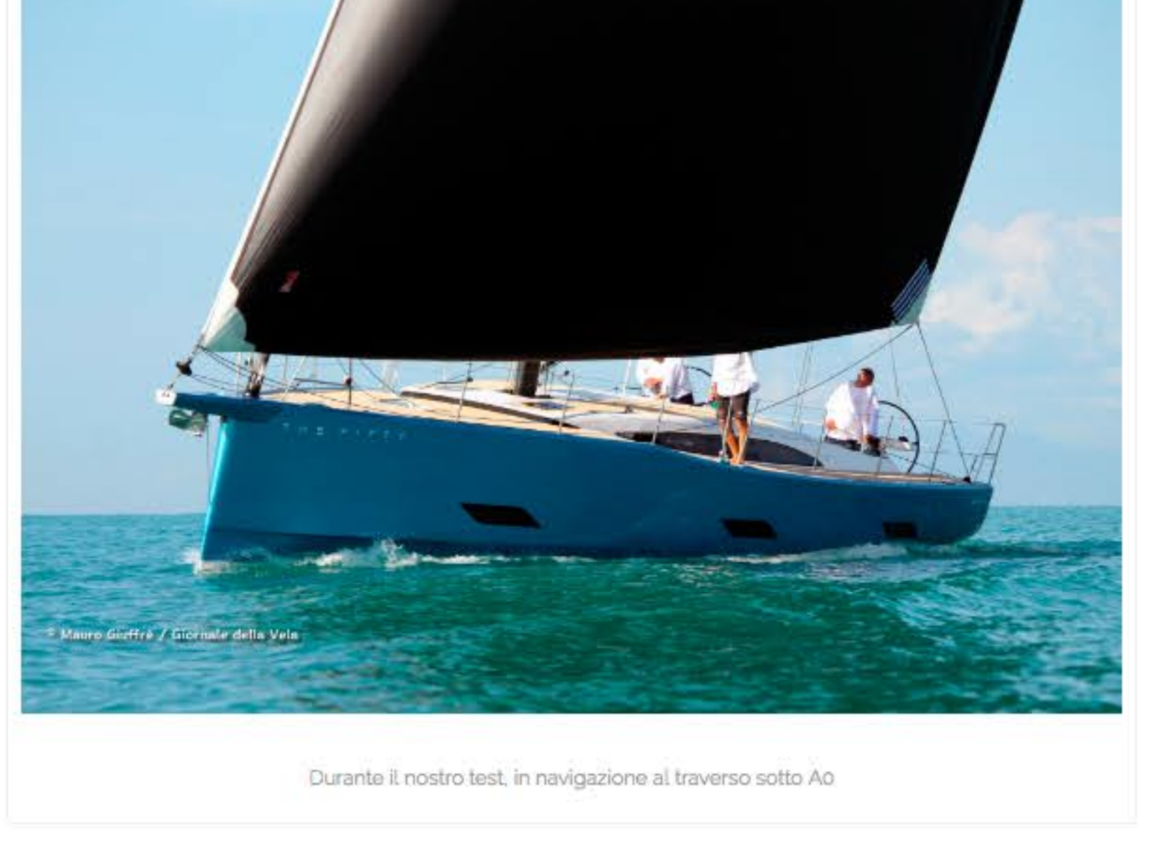
Durante il nostro test, in navigazione al traverso sotto A0

La giornata nelle acque toscane è stata di brezza leggera che non ha mai superato i 6-7 nodi, proprio le condizioni in cui una barca con simili ambizioni deve poter fare la differenza in termini di performance.