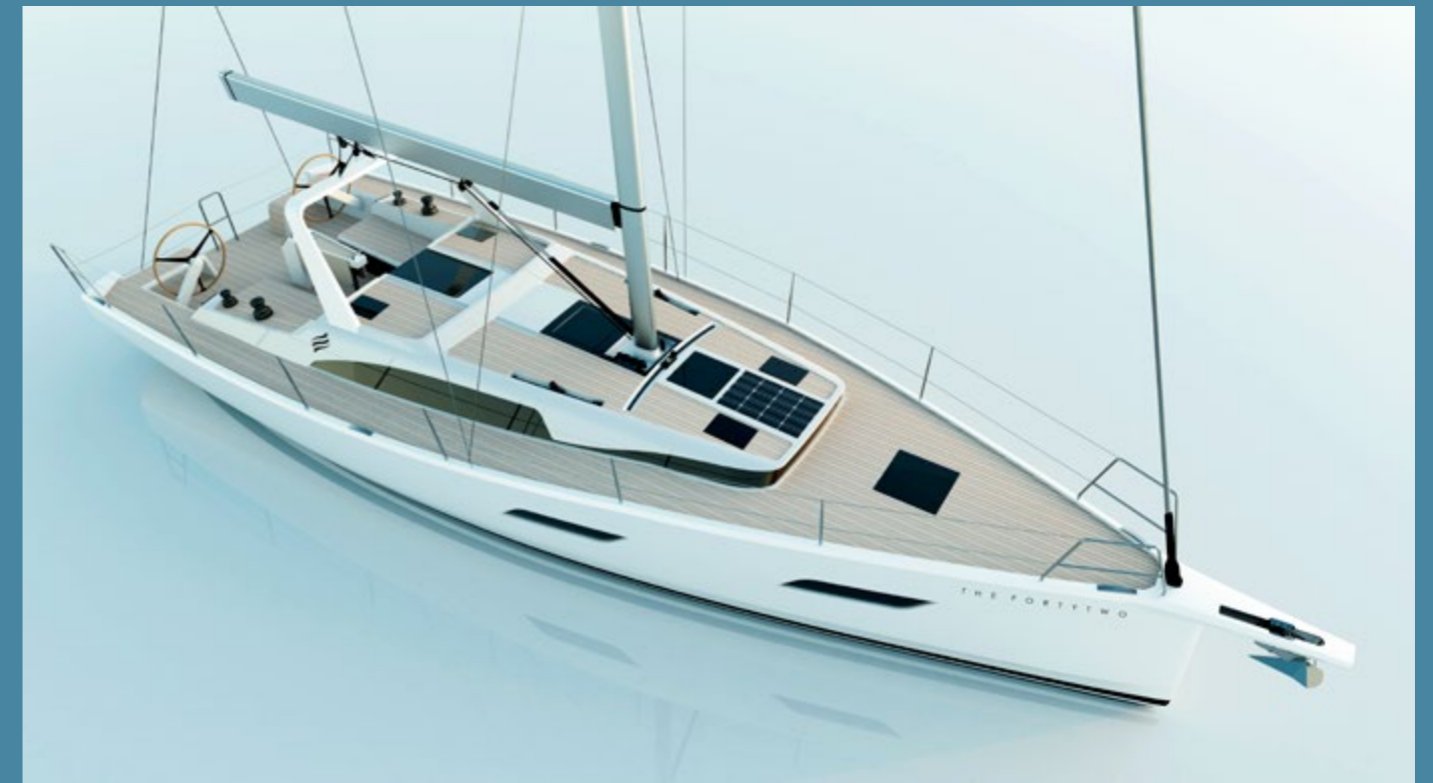
Allestimento Ocean / Version Ocean