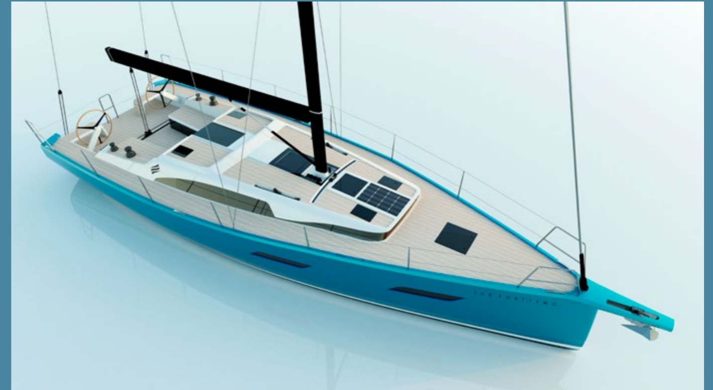
Allestimento Mediterraneo / Version Mediterraneo